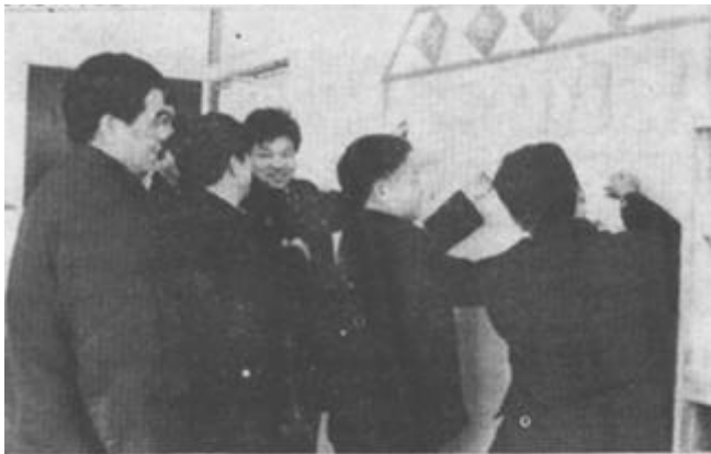
△市粮油储运公司在“三整顿”工作中，不走过场，注重实效。他们在学好文件的基础上，自我检查与群众帮助提问相结合，使广大干部工作作风、思想作风、纪律观念和为人民服务观念都有了可喜的变化。(崔丽英 摄)

抓获，查获油田钢铁吨。原来，这些盗贼是河口区六合乡庙一村几个农民，于2月8日在孤东油田偷盗钢铁吨，准备出售销赃，没想到碰到了勇猛顽强的联防队员。(段宗斌)