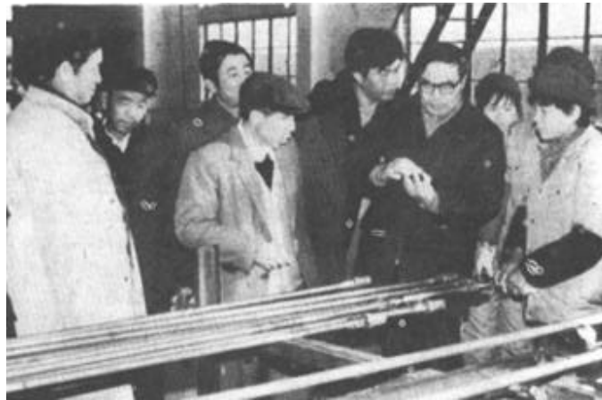
图为专家们在检验产品质量。